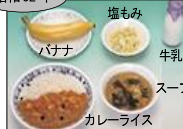
バナナ 塩もみ 牛乳 スープ カレーライス

学校給食制度に米飯が正式に導入されました。カレーライスは、今も昔も人気メニューのひとつです。