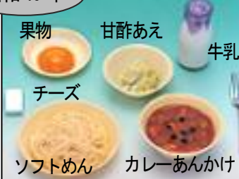
果物 甘酢あえ 牛乳 チーズ ソフトめん カレーあんかけ

ソフトめんが給食に登場です。この頃から、飲み物が脱脂粉乳から牛乳へと切り替わりはじめました。