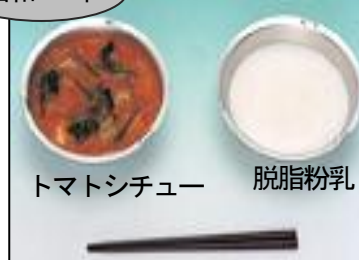
トマトシチュー 脱脂粉乳